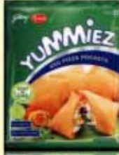
VEG PIZZA POCKETS

ಆಮ್ಲೆ ಲಾಗಿಂ ತಾಜಾ ದುಕ್ರಾ ಮಾಸ್, ರಗ್ಲಿ, ದುಕ್ರಾಚಿಂ ಸರ್ಪಾತೆಲ್, ದುಕ್ರಾಚಿಂ ಲೊಕ್ಲೆಂ ಕುಂಕ್ರಾ ಮಾಸ್ ಮೆಳ್ತಾ. ಇಂದಾ ಪೀಟ್, ವಾಯೆಚಿಂ ಮಾತ್ರಿಂ, ಡಯಾಬೀಟಿಸ್ ಆಸ್‌ಲ್ಹಾಂಕ್ ಕಸಾಯ್ ಪಿಟೋ, ವಾಯ್ ಪಿಡೆಂಚಿಂ ಭುರ್ಲ್ಯಾಂಚಿ ಮಾತ್ರಿಂ ಆನಿಂ ಪಂಚತಿಕ್ರಾ