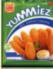
VEG CHEESE FINGERS