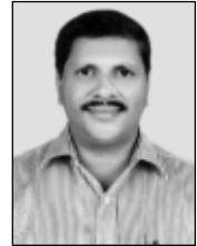
✍️ ವಾಲ್‌ಸ್ವನ್ ಡೇಸಾ,

ಮಿಶೆನ್ ಆಜ್ ಸಾಂಗ್ತಾ ತುಕಾ, ತುಂ ಮ್ಹಾಕಾ ನಾಕಾ, ನಾಕಾ, ನಾಕಾ