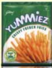
CRISPY FRENCH FRIES