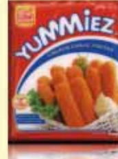
CHICKEN GARLIC FINGERS