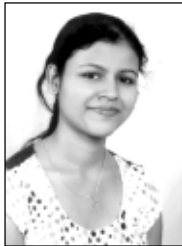
ಜೇಸ್ಸಾ ಡೇಸಾ ಕಾರ್ಯದರ್ಶಿ