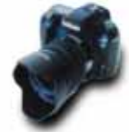
Photo & video for all Occassions