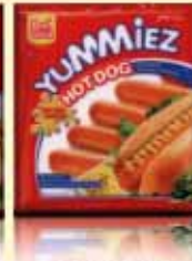
CHICKEN HOT DOG