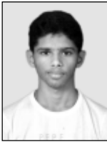
ವೈ.ಸಿ.ಎಸ್ ಶಿವಾರ್ ವಾರಾಡೊ ಅಧ್ಯಕ್ಷ ಜಾವ್ನ್ ಜೋಯ್ನ್ ಡೆ'ಸಾ ವಿಂಚೊನ್ ಆಯ್ಲಾ