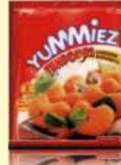
CHICKEN TANDOORI NAGGETS

ತಾಜಾ ದುಕ್ರಾಮಾಸ್, ರಗ್ಲಿ ಆನಿ ಕುಂಕ್ರಾಮಾಸ್ ಸದಾಂ ಮೆಳ್ತಾ