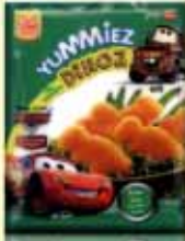
VEG DINOZ NUGGETS

ತಾಜಾ ದುಕ್ರಾಮಾಸ್, ರಗ್ಲಿ ಆನಿ ಕುಂಕ್ರಾಮಾಸ್ ಸದಾಂ ಮೆಳ್ತಾ