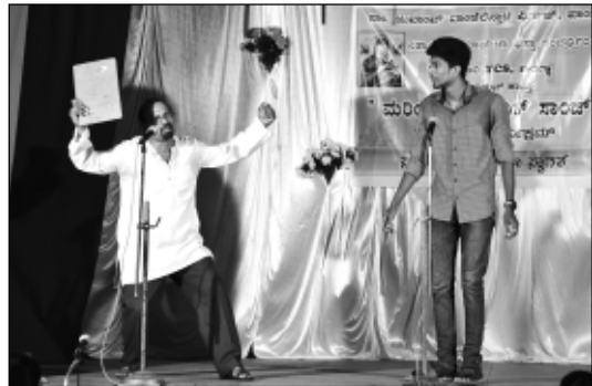
ಐ.ಸಿ.ವೈ.ಎಮ್. - ನಾಟುಳೊ