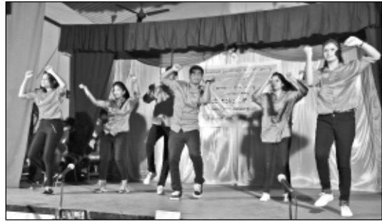
ಐ.ಸಿ.ವೈ.ಎಮ್. - ಡಾನ್ಸ್