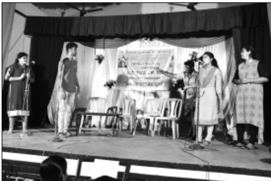
ವೈ.ಸಿ.ಎಸ್. - ನಾಟ್ಯಳೊ