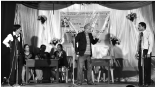
ಎಸ್.ವಿ.ಪಿ. - ನಾಟುಳೊ