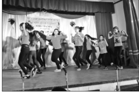
ಮರಿಯಾಳ್ ಸೊಡಾಲಿಟಿ - ಡಾನ್ಸ್