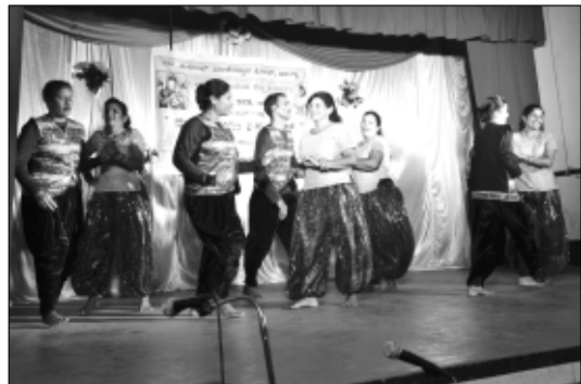
ತಿಸ್ತಿ ಓಡ್ಡ್ ಆನಿ ಕಥೊಲಿಕ್ ಸಭಾ - ಡಾನ್ಸ್