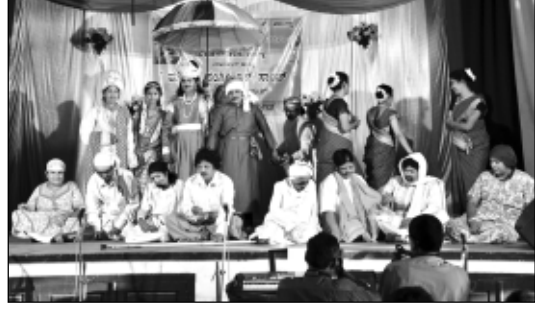
ಸ್ತ್ರೀ ಸಂಘಟನ್ - ರೂಪಕಾ