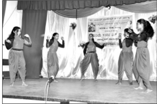
ವೈ.ಸಿ.ಎಸ್. - ಡಾನ್ಸ್