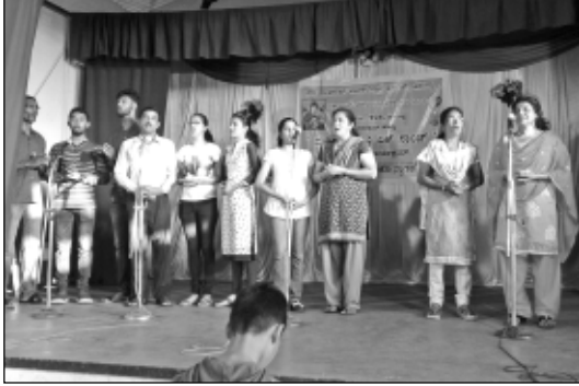
ಪ್ರಾರ್ಥನ್ - ಗಾಯನ್ ಪಂಗಡ್