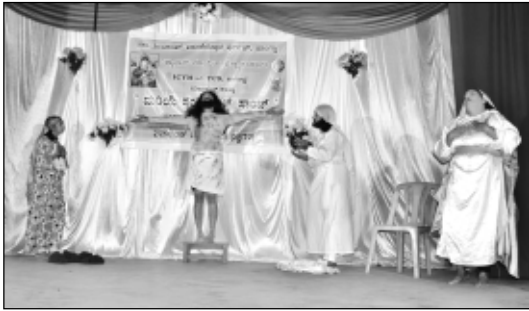
ಲೀಜನ್ ಆಫ್ ಮೇರಿ - ನಾಟುಳೊ