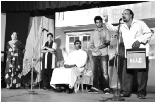
ಗರ್ಜಿಕ್ ಮಾತ್ರ ಮರ್ಜಿಕ್ ಸ್ವಯ್ - ನಾಟಕ್