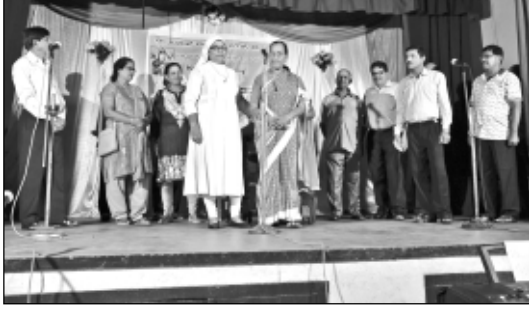
ಎಸ್.ವಿ.ಪಿ. - ನಾಟುಳೊ