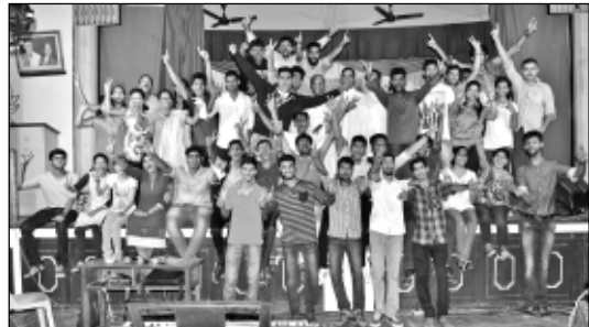
ವೈ.ಸಿ.ಎಸ್. ಆನಿ ಐ.ಸಿ.ವೈ.ಎಮ್.